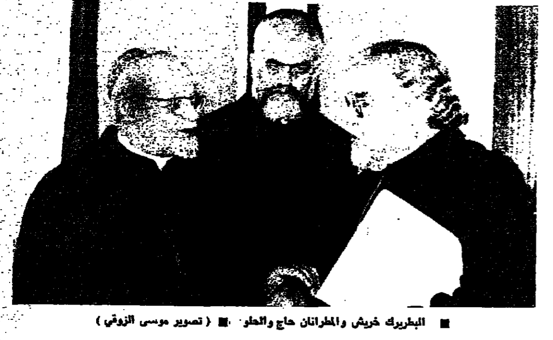
البربرك خريش والمهران حاج والطار.

كشفت « الأهرام » امس انه تم اعتقال ضابطين من مسؤولي الاستخبارات الليبية قرب الحدود المصرية - اغتيال وتخريب.